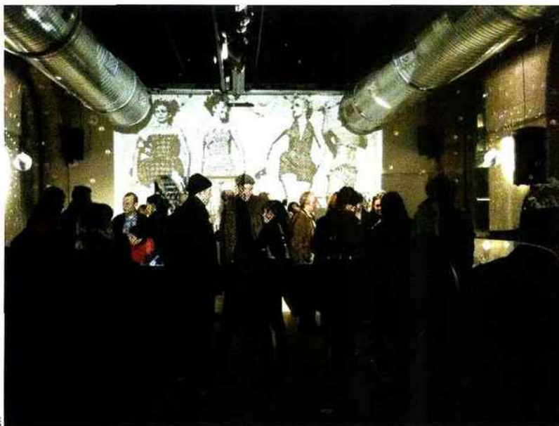
Programme d'enfer : une fondue à la Buvette des Bains du Pâquis (ci-dessous), d'où l'on voit tout Genève illuminé la nuit venue, prendre un dernier verre au milieu de l'eau à la Brasserie des Halles de l'île (en bas), un autre lieu atypique de la cité. Le lendemain matin, opération détox au jardin botanique (ci-dessous).