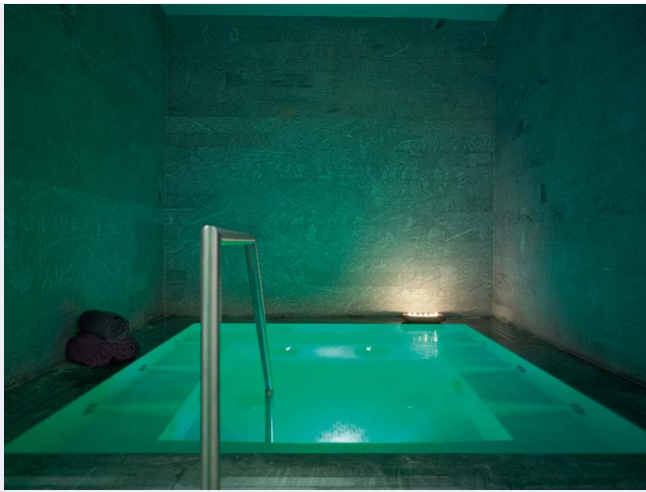
Le jacuzzi de l'Espace Payot

Spa My blend by Clarins , hôtel Royal Monceau , 39 avenue Hoche, 75008 Paris, 01 42 99 88 99.