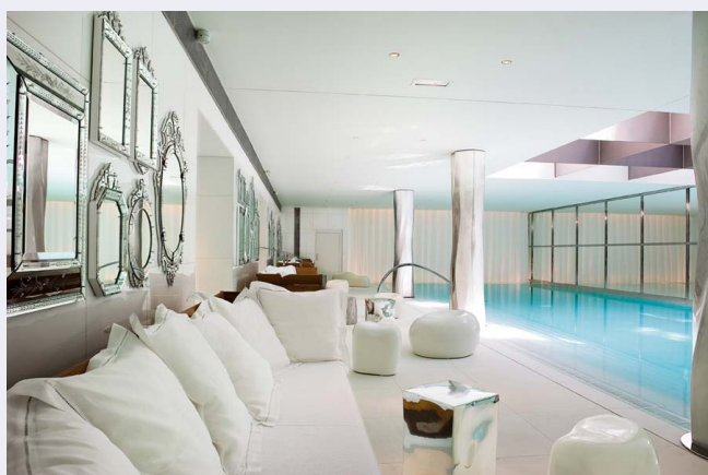
La piscine du spa de l'hôtel Royal Monceau

Le spa My blend by Clarins , situé au sein de l'hôtel Royal Monceau , est très attendu. Pour preuve, le palace parisien a vu les choses en grand. Imaginé et dessiné par Philippe Starck , le spa s'étend sur 1500 m 2 avec sauna, hammam, laconium (sorte de sauna finlandais) et une piscine de 28 m de long. Ouverture prévue début septembre. La journée : 190 €.