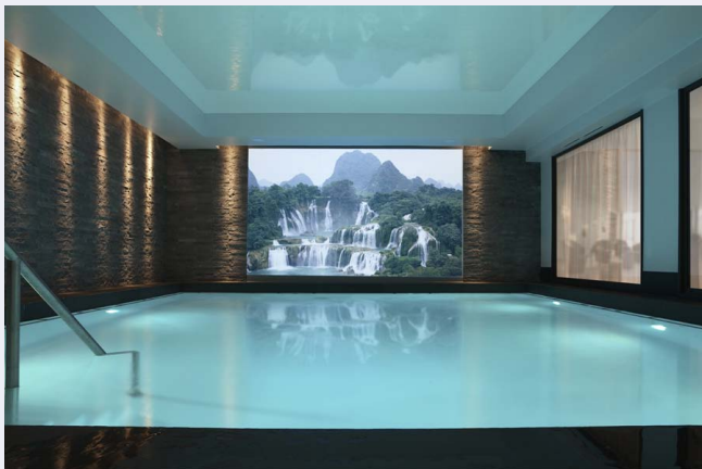
La piscine de la Villa Thalgo

La Villa Thalgo mérite aussi le détour. Ce spa de près de 1000 m2 mise tout sur l'eau de mer. Ainsi le hammam de la mer, avec ses diffusions de sels marins, d'ions négatifs et de parfum iodé, est aussi vivifiant qu'une longue promenade en bord de mer. Parcours hydromassant et aquagym sont également prévus dans la piscine. Pass demi-journée : 100 € (fitness, aquagym, parcours hydro et hammam). Soins à partir de 45 €.