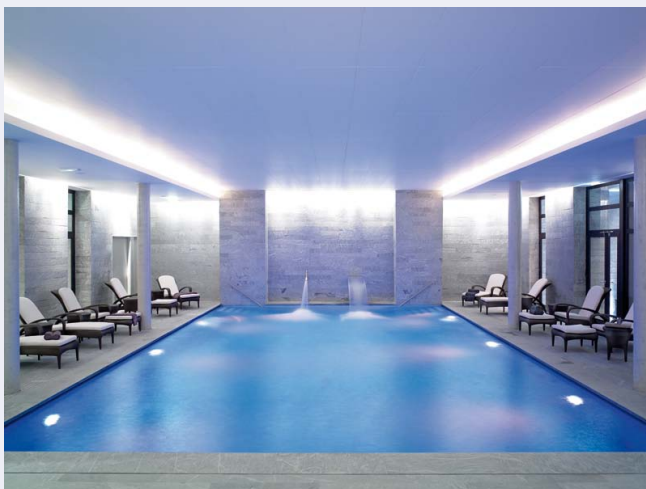
La piscine de l'Espace Payot

Enfin, le spa Payot , situé en plein cœur du Triangle d'Or, n'a rien à envier aux autres. Avec un jacuzzi, une piscine et un sauna, L'Espace Payot , d'une superficie de 1200 m 2 , propose toutes sortes de soins et de massages. Soins à partir de 40 € (cuir chevelu 15 min). Pour accéder à l'espace détente (piscine, sauna, jacuzzi), il faut faire un soin au minimum de 150 €.