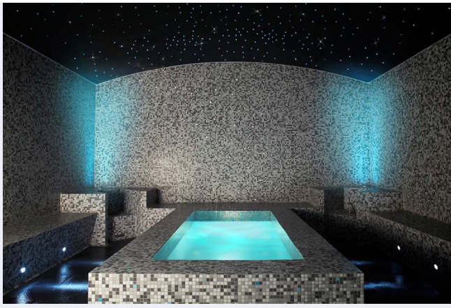
Le hammam de la Villa Thalgo