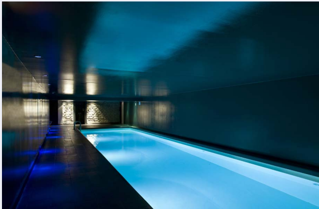
La piscine du spa de l'hôtel Saint James & Albany