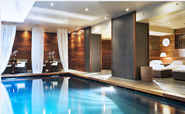
La piscine du spa de l'hôtel Renaissance

The Vendôme Spa , au sein de l'hôtel Renaissance Paris Vendôme , situé à deux pas de la célèbre place, est, quant à lui, spécialisé dans les techniques de massages traditionnels thaïlandais. Après le soin, il est possible de profiter du bassin de 11 mètres sur 4 entouré de lambris et éclairé par un puits de lumière naturelle, du sauna et du hammam. Accès à la piscine, au sauna et au hammam 50 € en complément d'un soin. Soins à partir de 75 €.