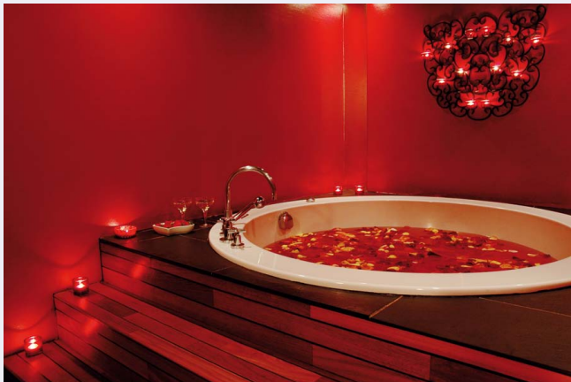
Le bain aux pétales de roses du spa de l'hôtel Saint James & Albany