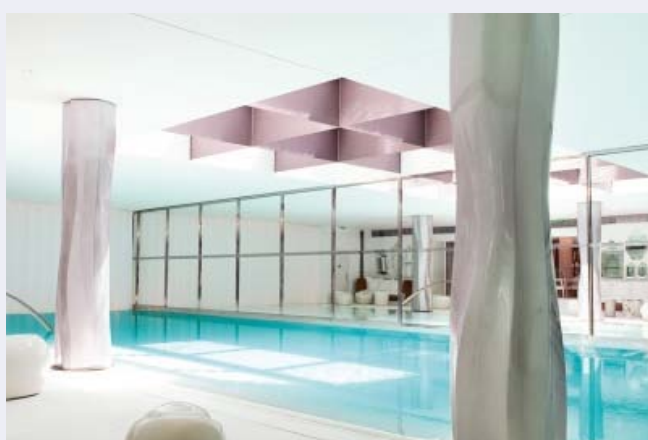
La piscine du spa de l'hôtel Royal Monceau

Les vacances sont finies depuis peu et déjà le train-train de la vie quotidienne -avec son lot de stress- reprend. Pour éviter la déprime de la rentrée, rien de tel que de prendre le temps de s'occuper de soi en s'offrant une parenthèse bien-être. Paris regorge de spas où il fait bon buller loin du brouhaha de la ville. Voici cinq adresses paradisiaques.