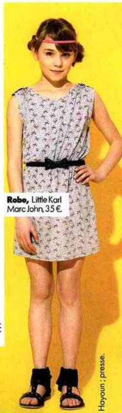
Robe, Little Karl Marc John, 35 €.

■ Hôtel Saint James & Albany, 202, rue de Rivoli (1 er ). Tél. : 01 44 58 43 77. SABINEROCHÉ