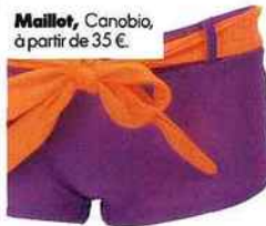
Maillot, Canobio, à partir de 35 €.