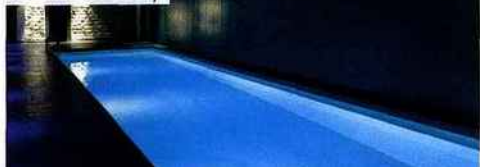
Hôtel Saint James & Albany.

Quoi de neuf pour les ados? Ça bouge cet été sur la planète teen... La preuve par 7!