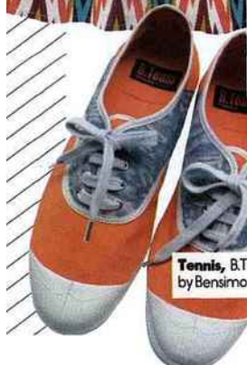
Tennis, B.Team by Bensimon, 35 €.