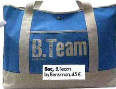
Sac, B.Team by Bensimon, 45 €.