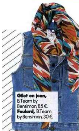
Gilet en jean, B.Team by Bensimon, 85 €. Foulard, B.Team by Bensimon, 30 €.

■ 14 € par jour de frais de pension. Contact et informations au 03 44 72 33 98 et sur www.clubduvieuxmanoir.fr