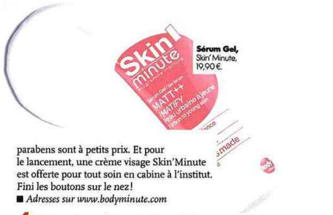
Sérum Gel, Skin'Minute, 19,90 €.

Les instituts Body Minute lancent Skin'Minute, une gamme de soins pour peau jeune et urbaine (traduire polluée). Lotion purifiante, masque, sérum, crème de jour, les produits sans