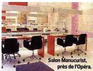
Salon Manucurist, près de l'Opéra.

1-3 Se faire des doigts de fée grâce au perfect polish, une pose de vernis qui tient quinze jours chez Manucurist , 45 €. www.manucrist.com .