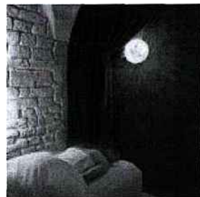
Le spa suisse After the Rain propose une