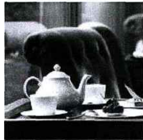
Les Etangs de Corot organise depuis la rentrée des après-midi littéraires à l'heure du thé.

Yoga Factory , 21, rue des Filles-du-Calvaire (IIIe). Tél.: 01 83 94 29 08.