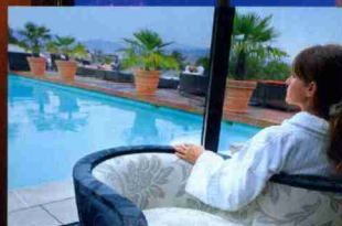
1 ANNECY Le spa des Trésors, entre lac d'Annecy et montagnes.