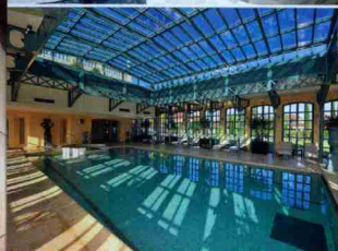
2 VONNAS Chez Georges Blanc, bien-être et gastronomie font bon ménage.