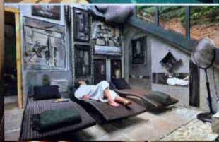
3 LYON A la Cour des Loges, une déco signée Philippe Starck.

La région Rhône-Alpes, premier réservoir d'eau douce de France, est toute désignée pour s'évader en toute quiétude et se ressourcer. Voici, nichés dans des hôtels de tous les styles, nos établissements coups de cœur. TEXTE ISABELLE JACCAUD