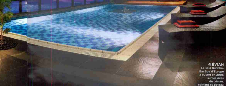
4 ÉVIAN Le seul Buddha- Bar Spa d'Europe a ouvert en 2006 sur les rives du Léman, coiffant au poteau Duke & Osak

La région Rhône-Alpes, premier réservoir d'eau douce de France, est toute désignée pour s'évader en toute quiétude et se ressourcer. Voici, nichés dans des hôtels de tous les styles, nos établissements coups de cœur. TEXTE ISABELLE JACCAUD