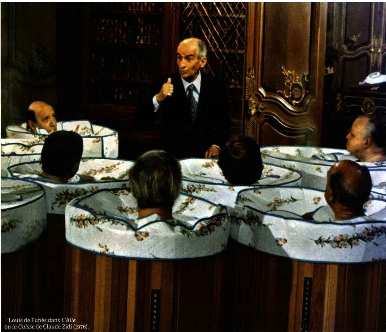
Louis de Funès dans L'Aile ou la Cuisse de Claude Zidi (1976).