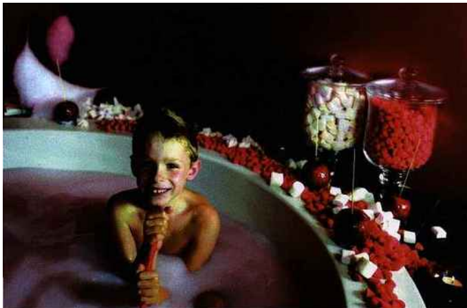
Ci-dessus et en haut à gauche, After the rain.

Prix : la « Recette de Mélusine », gommage du