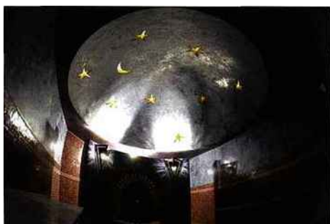
À gauche, Le Hammam des Cents ciels.

Les résidences de tourisme CGH : cette nouvelle tendance ne se cantonne pas aux spas urbains et aux hôtels de luxe, elle agrmente également les cartes de soins proposées par les résidences de tourisme haut de gamme. Dans les spas d'altitude des résidences