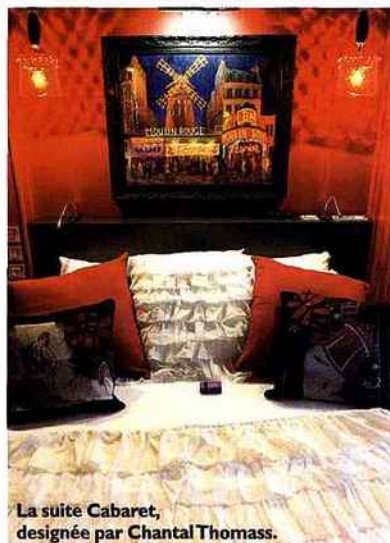
La suite Cabaret, designée par Chantal Thomass.